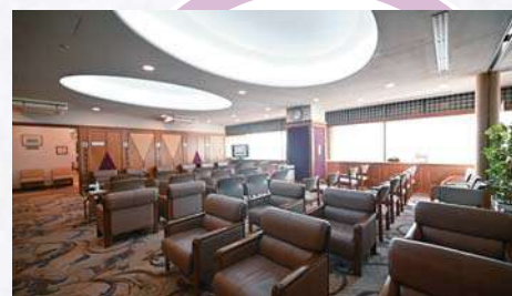
メインロビー 解放感のある落ち着いたフロアでリラックスして受診していただけます。晴れた日は明石海峡大橋まで臨める眺望もお楽しみください。