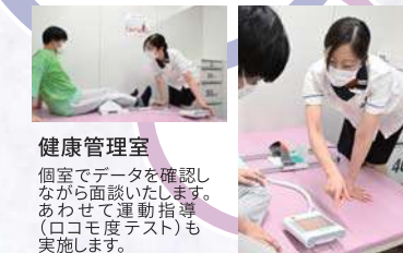
健康管理室 個室でデータを確認しながら面談いたします。あわせて運動指導（ロコモ度テスト）も実施します。