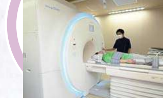
MRI室 AI搭載の機器で、従来より静かで短時間で受けていただけます。頭部以外の、腹部、骨盤、頸椎、腰椎の検査も実施しております。