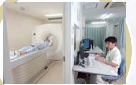
CT室 被曝軽減に配慮した新しいCTです。