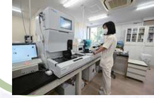
検体検査室 院内検査で、血液検査などの結果を迅速にご報告します。