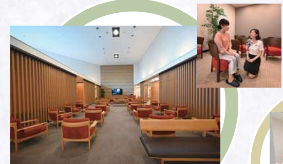
メインロビー 広いスペースを設けました。検査の合間におくつろぎいただけます。