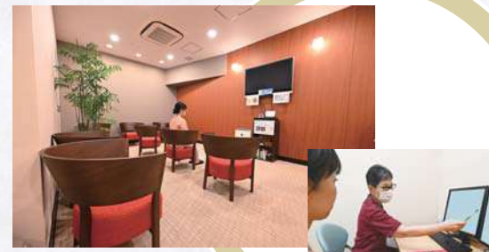
レディースフロア 婦人科健診は独立した女性専用の空間で。