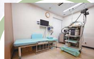
内視鏡室 (胃カメラ検査室)