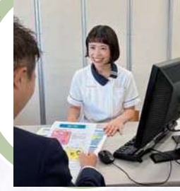
健康管理室 お客さま専任の担当者がプライバシーに配慮したお部屋でゆっくりお話を聞きながら生活改善をサポートいたします。