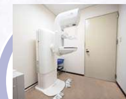
マンモグラフィ検査室 日本乳がん検診精度管理中央機構評価認定を受けた施設です。検査は女性技師が担当いたします。