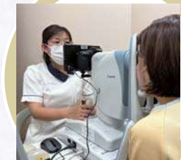
生理検査室 (眼底検査)